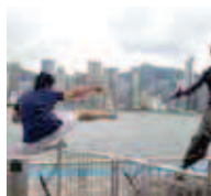
Bruce Lee, Κίνα