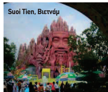
Suoi Tien, Βιετνάμ