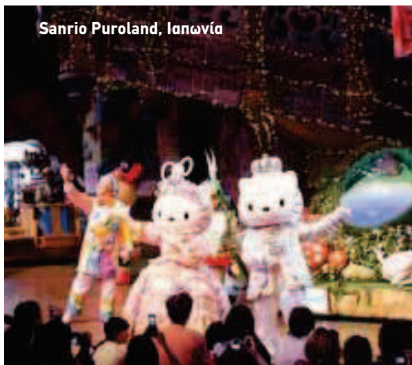
Sanrio Puroland, Ιαπωνία