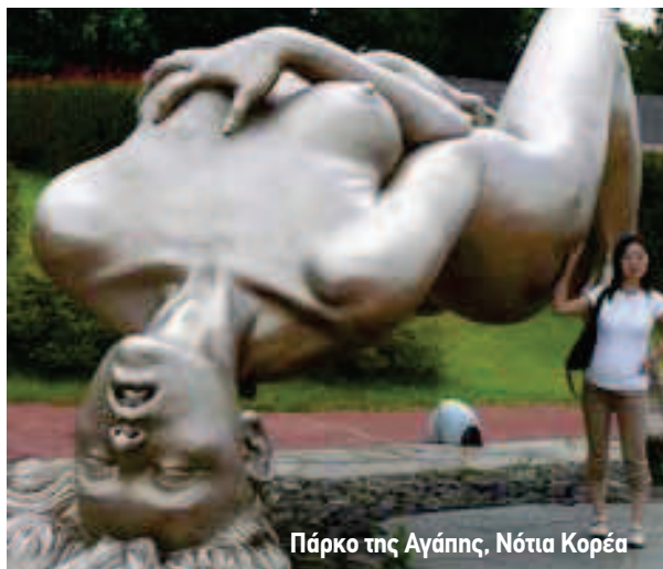
Πάρκο της Αγάπης, Νότια Κορέα

Η γάτα-μασκότ αυτού του πάρκου έχει διαταραγμένη προσωπικότητα. Έχει βγει από τα NAMCO video games, όπως τα Pac-Man, που υποτίθεται ότι απευθύνονται σε παιδιά. Όμως στη συγκεκριμένη περίπτωση οι διαδρομές εντός του πάρκου έχουν σχεδιαστεί ως ένα στοιχειωμένο μπουντρούμι, προσελκύνοντας, από το 1996 οπότε και άνοιξε τις πύλες του, κατά χιλιάδες τους νέους του Τόκιο, που θέλουν να ζήσουν στιγμές αγωνίας!