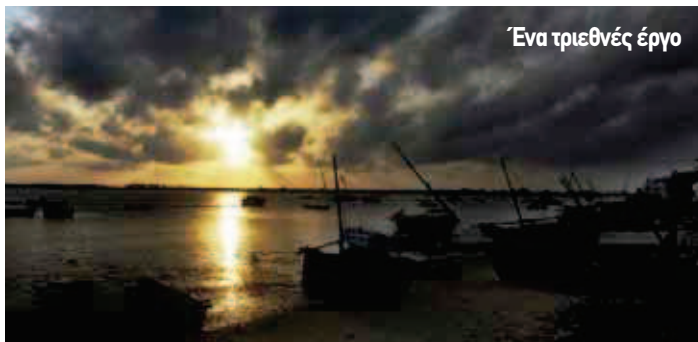
Ένα τριεθνές έργο

Το 2012, οι πρόεδροι της Κένυα, της Αιθιοπίας και του Νότιου Σουδάν, εγκαινίασαν από κοινού το εξαιρετικά φιλόδοξο έργο LAPSET, την μετατροπή του γραφικού λιμανιού της Λάμου, στο Νότιο Σουδάν, ως ένα από τα μεγαλύτερα διαμετακομιστικά κέντρα του κόσμου. Παρά τις περιβαλλοντικές ανησυχίες που έχουν εκφραστεί, αφού το λιμάνι Λάμου συμπεριλαμβάνεται στον κατάλογο των μνημείων Παγκόσμιας Πολιτιστικής Κληρονομιάς, τα σχέδια περιλαμβάνουν την κατασκευή ενός διυλιστηρίου πετρελαίου, όπου θα φτάνουν οι αγωγοί από τις πετρελαιοπηγές του Νότιου Σουδάν, ενός μεγάλου λιμανιού για πετρελαιοφόρα, κι ενός ακόμη για εμπορεύματα και επιβάτες, ενός αεροδρομίου, σιδηροδρομικού δικτύου, όλα αυτά πλά σε ένα εκτεταμένο τουριστικό θέρετρο. Ο προϋπολογισμός του έργου ανέρχεται σε 25 δισ. δολάρια και ήδη ένα τμήμα του ανέλαβε να κατασκευάσει μετά από διαγωνισμό μια κινεζική εταιρεία.