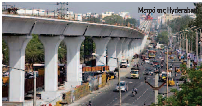
Μετρό της Hyderabad

Με ένα συνολικό μήκος 72 χιλιομέτρων και με σταθμούς ανά ένα χιλιόμετρο, το Μετρό της τέταρτης από πλευράς πληθυσμού (περίπου 8 εκατ. κάτοικοι) πόλης της Ινδίας, ως το μεγαλύτερο έργο ΣΔΙΤ που κατασκευάζεται ανά τον κόσμο. Με προϋπολογισμό 2,1 δισ. δολάρια ξεκίνησε να κατασκευάζεται το 2011 με σκοπό να λειτουργήσει το 2017, με ημερήσια μεταφορική ικανότητα 1,7 εκατ. επιβατών, αλλάζοντας άρδην τα χαστικά κυκλοφοριακά δεδομένα αυτής της πόλης της νότιας Ινδίας.